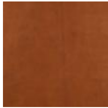
Mööblinahk Oliiv pargitud Vitoria Saddle 1100909