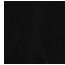
Mööblinahk Vitoria Black 1100915