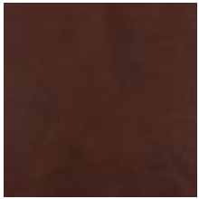
Mööblinahk Vitoria Mahagoni 1100917