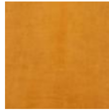
Mööblinahk Vitoria Maple 1100920