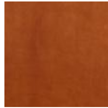
Mööblinahk Vitoria Oak 1100919