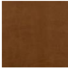
Mööblinahk Vitoria Tabac 1100918