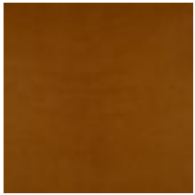
Mööblinahk Oliiv pargitud Vitoria Cognac 1100907